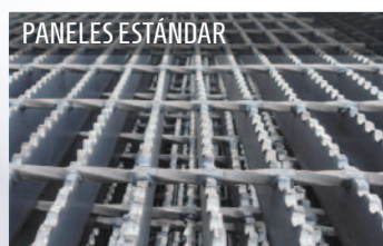
● Paneles estándar (965 X 6000 mm).