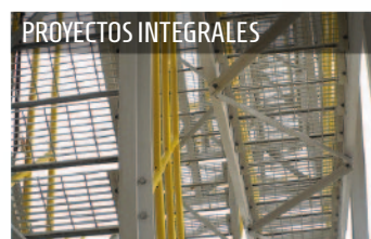
● Proyectos integrales para la industria, comercio, arquitectura y vialidad.