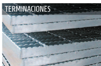
● Terminación estándar: Negro y galvanizado. ● Terminaciones a pedido especial.