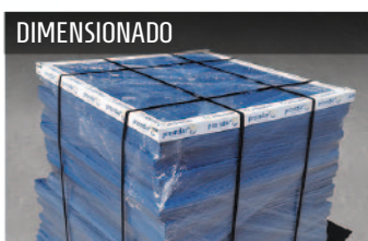
● Suministro de grating dimensionado.